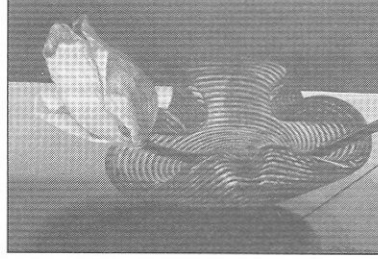
Resim: Aydın AYAN