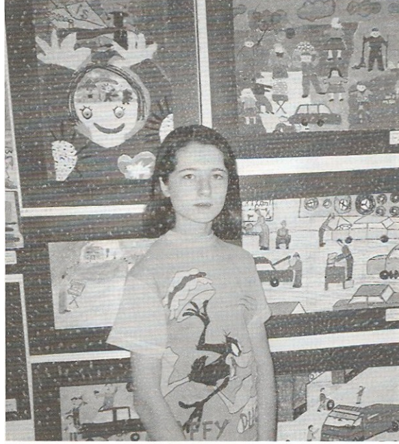
Ankara'da Çocuk Olmak

Sürekli yenilenmesine, böylece, bir izleyenin tekrar tekrar izlemesine olanak sağlayacak bir nitelik taşımasını amaçlıyoruz.